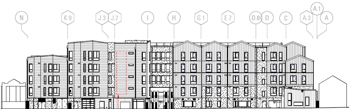
外观立视图 - 西侧 - 43 RD AVE 3/64" = 1'-0"