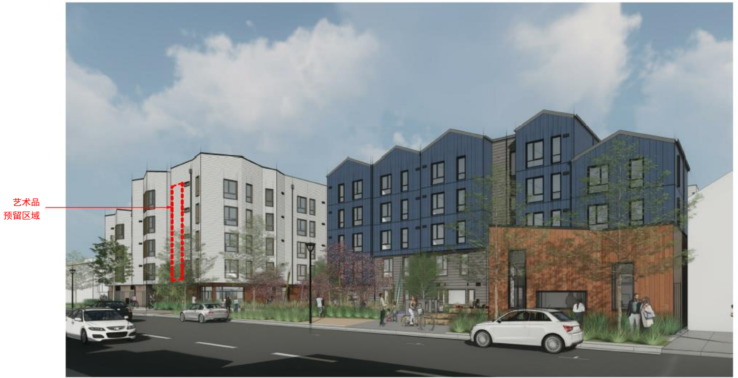
效果图和立面图，由 BAR Architects 提供